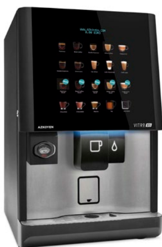
Kit de Integración para sistemas cashless MDB en máquina

La máquina es compatible con Pay4Vend permitiendo el pago directamente desde el móvil.