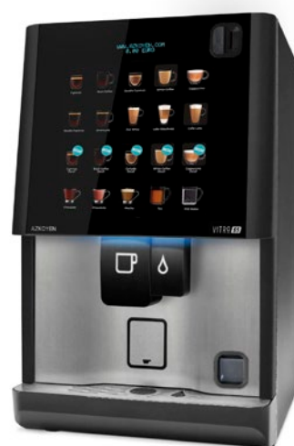
Integración para sistemas MDB de devolución de monedas en máquina