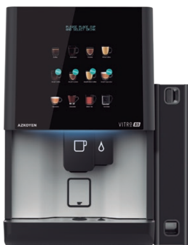
Módulo exterior para la instalación de medios de pago MDB